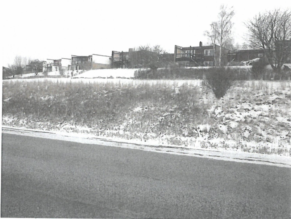
Suterränghus utmed Rönnebjersgatan, fotograferade från Västra Infarten